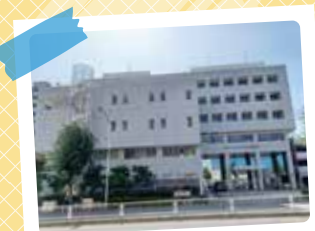
AOI名古屋病院 TEL 932-7152