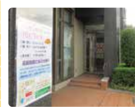
ジョイフル砂田橋 TEL 723-3111