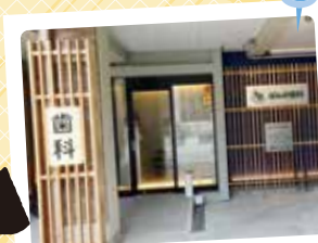
ばんの歯科 TEL 932-2001