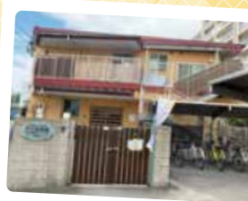
やだ保育園 TEL 768-6510