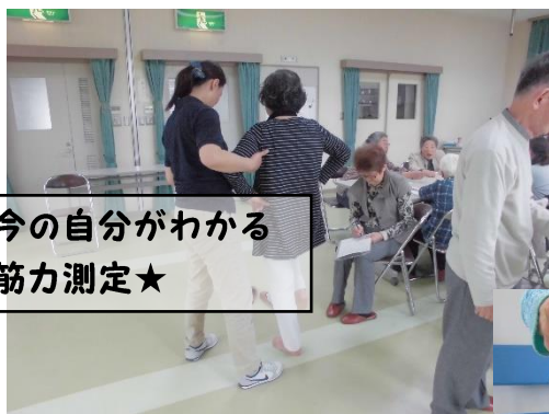
今の自分がわかる 筋力測定★

もみじクラブでは、住み慣れた地域の会場で毎週1回、地域の仲間と一緒にさまざまな介護予防や地域活動を楽しんでいます!