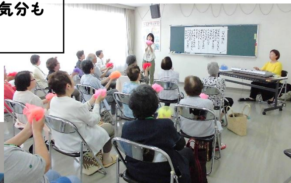
音楽療法で脳も気分も リフレッシュ!