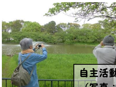
自主活動・地域活動で活動範囲を拡大!